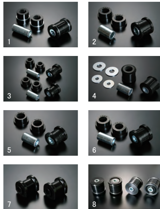
【テインブッシュ TEIN BUSH】